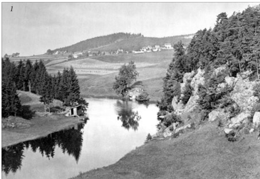
1 – Stará plovárna (1920)