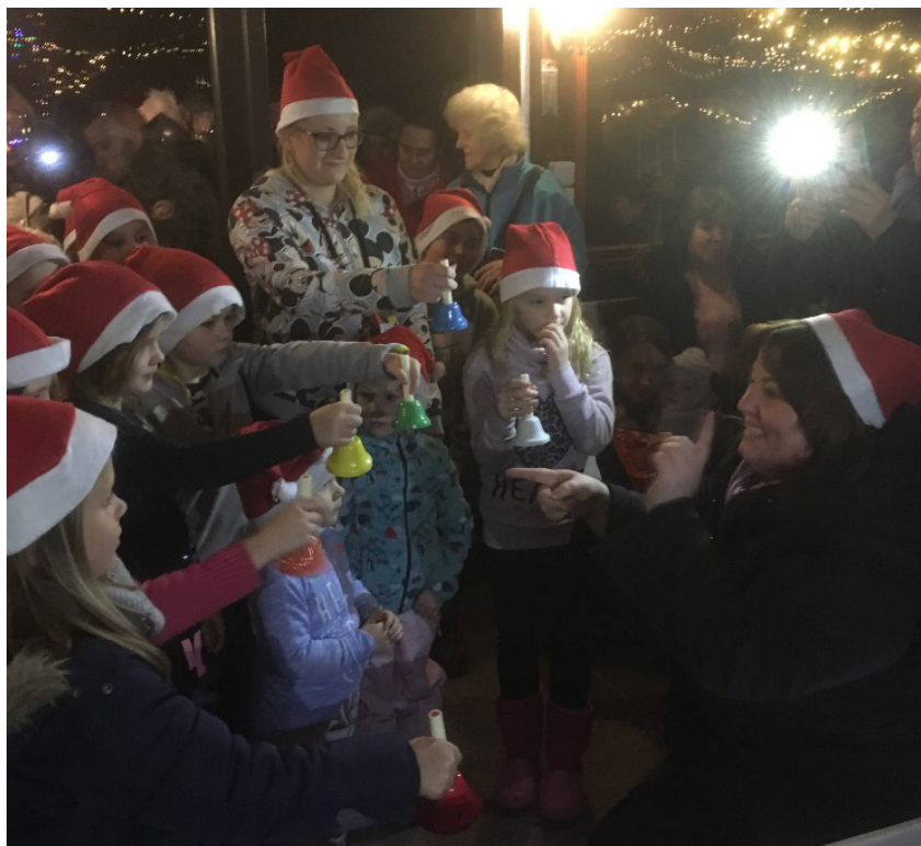
Zahájení školního roku akce "20 let spolu" a mikulášská v MŠ a ZŠ Libá