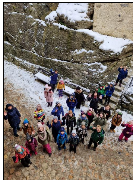
Obrázek 8 - Výlet na hrad Loket