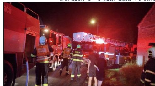
Obrázek 3 - Požár auta v Polné

Dále se jednotka zúčastnila několika odborných příprav a tří cvičení. Jedno cvičení se konalo u nás v Libě, kde bylo námětem požár rodinného domu. Další cvičení se konalo v obci Hazlov, kde bylo námětem pátrání po ztracených osobách. Poslední cvičení Luxor, které proběhlo v bývalých kasárnách v Klimentově se zaměřením na živelné pohromy.