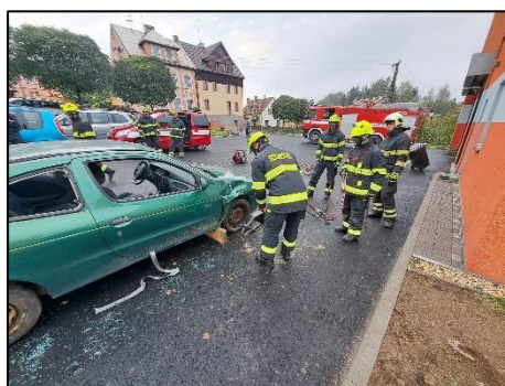
Obrázek 4 – Cvičení (stříhání auta)

Dále se jednotka zúčastnila několika odborných příprav a tří cvičení. Jedno cvičení se konalo u nás v Libě, kde bylo námětem požár rodinného domu. Další cvičení se konalo v obci Hazlov, kde bylo námětem pátrání po ztracených osobách. Poslední cvičení Luxor, které proběhlo v bývalých kasárnách v Klimentově se zaměřením na živelné pohromy.