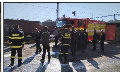
Obrázek 5 - Hlášení požár kotelny Libá Camp Obrázek 6 - Odborná příprava (strom na trati)