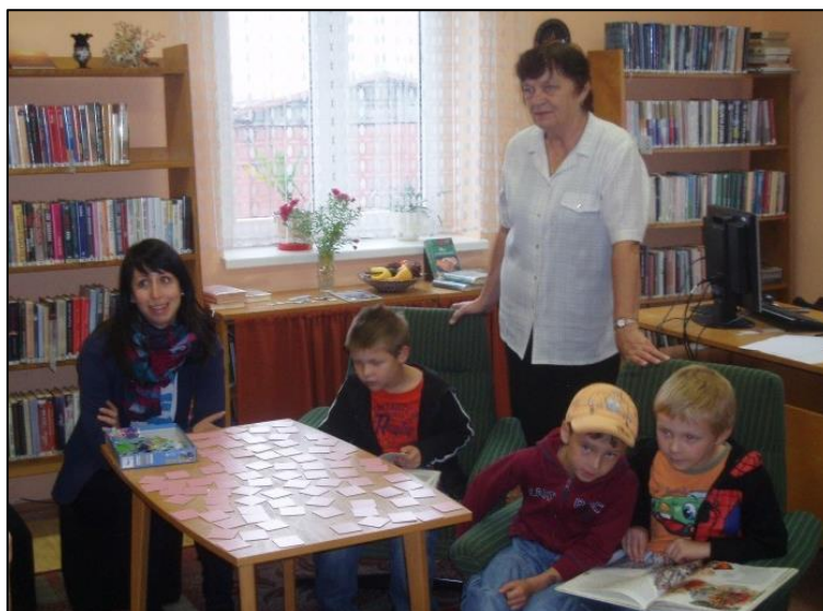
Obrázek 2 – Libská knihovna a návštěva dětí místní ZŠ

Vážení občané, přátelé a sousedé, čeká nás významný rok, tento rok obec Libá oslaví 760. rok svého založení. Postavme toto výročí a naši další budoucnost na těch příbězích, zkušenostech a lidech, na které vzpomínáme rádi, s úctou a s příjemným pocitem a pojďme vše toto pozitivní dál rozvíjet.