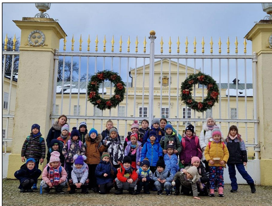
Obrázek 9 - Výlet zámek Kynžvart