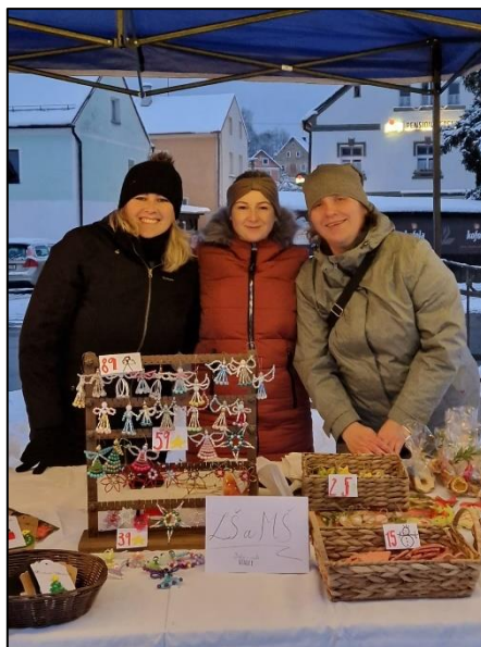
Obrázek 7 - Libské vánoční trhy