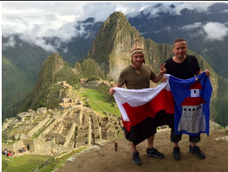
Machu Pichu Peru