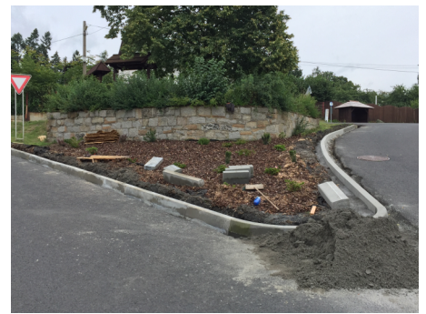
Úprava sjezdu ke škole, nové obrubníky a osázení okrasnými